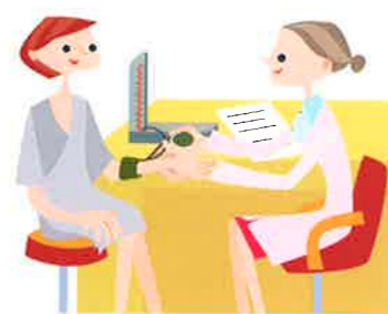
女性の日には当センターの健診スタッフも女性を中心に編成しています。(北茨城市健診風景)