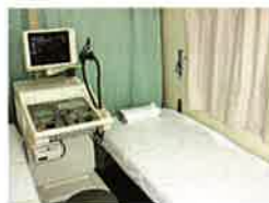
超音波でみることのできる病変 乳がん、線維腺腫、乳腺症など。