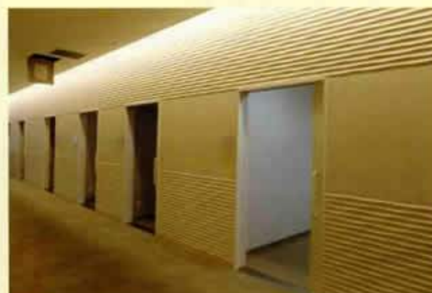
② ドック健診フロア